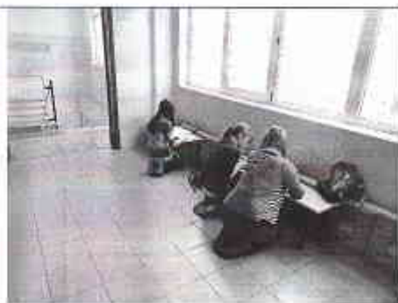
Когда не хватает кабинетов...