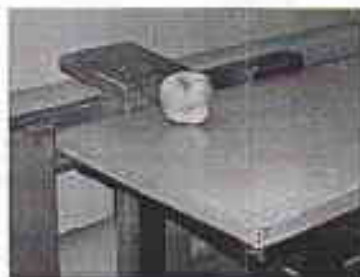
Яблоко, идущее своего хозяина с урока.